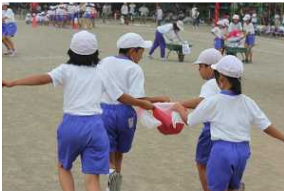
児童会種目「みんなで集めて大きな力」 …姉妹学級による 東日本大震災支援の 取り組みを競技にしたもの

「残せた伝統」として「一生懸命やる」「助け合う」「やり遂げる」「全力で」「本気で」「応援する」「勝ち負け関係なく」「お手本に」などの回答も、それぞれ1割前後ありました。運動会を通して、子ども達の心も十分に育っていることが感じ取れます。