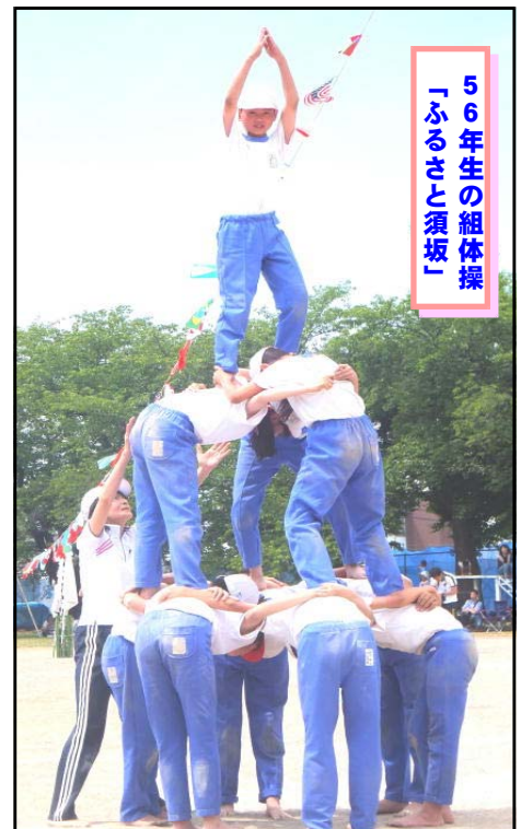
56年生の組み体操 「ふるさと須坂」