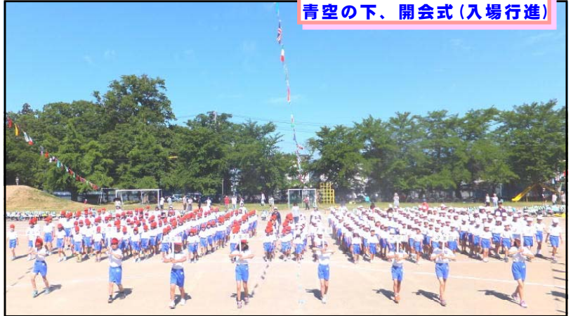
青空の下、開会式(入場行進)