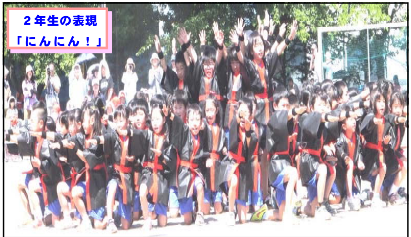
2年生の表現 「にんにん！」