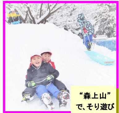
“森上山” で、そり遊び