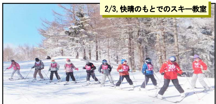
2/3, 快晴のもとでのスキー教室