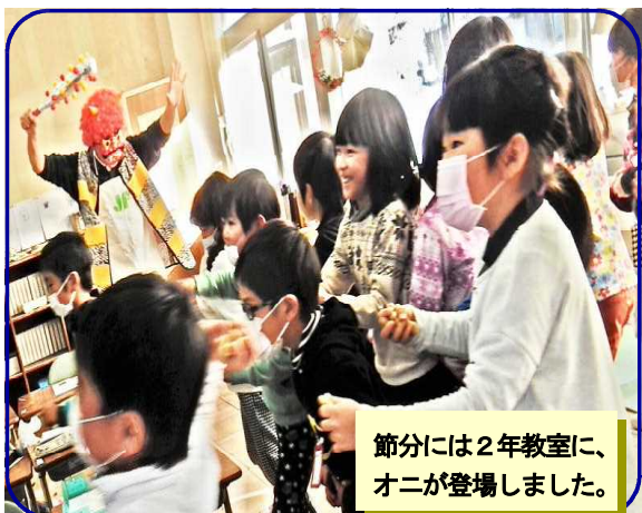
節分には2年教室に、オニが登場しました。

今週15日（水）の校長講話では、みつをの詩などを紹介しながら、様々な障がいを持つ子どもの目線になってえがかれている、絵本「どんなかんじかなあ」（ぶん：中山千夏 え：和歌山）の読み聞かせをする予定です。ぜひ、お子さんに様子を聞いてみてください。