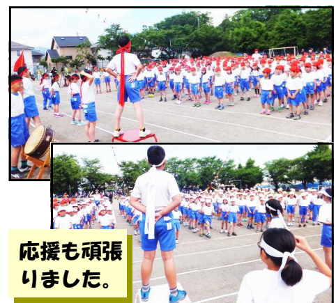
応援も頑張りました。