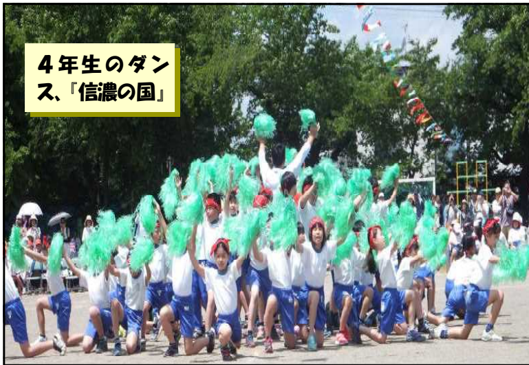
4年生のダンス、「信濃の国」