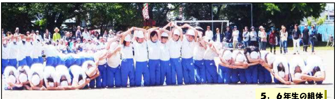
5. 6年生の組体操「ふるさと須坂」