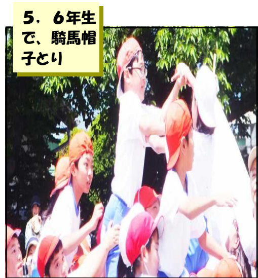
5. 6年生で、騎馬帽子とり