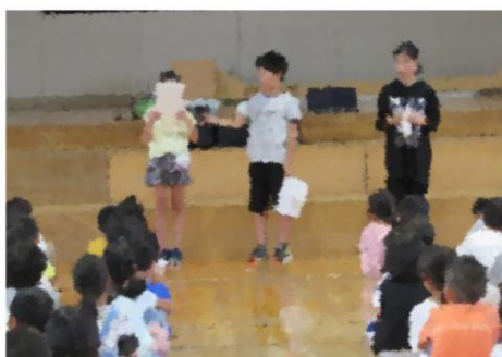
始業式では4・5・6年生が夏休みの思い出、2学期へ向けての目標をしっかりとした声で発表しました。

日頃は本校教育活動にご理解とご協力をいただきまして本当にありがとうございます。昨日、子どもたちのがんばり、そして、保護者の皆様、地域の皆様方のおかげで、2学期を無事にスタートすることができました。本当にありがとうございました。