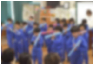
1年生：まずは鍵盤ハーモニカの発表

今年度最後の参観日を行いました。両日とも、多くの皆様にご来校いただくことができました。ありがとうございました。天候が悪く、校庭を駐車場として開放できない日もありました。ご協力ありがとうございました。