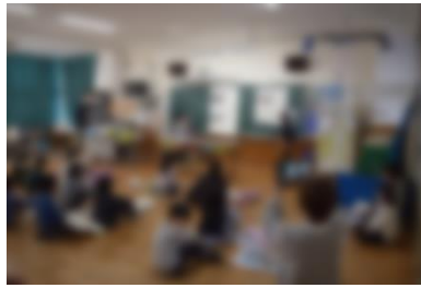
2年生：2年の学習を班ごとに発表