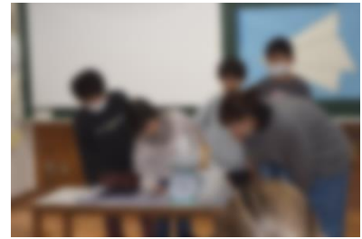
3年生：発表中おうちの人の参加も